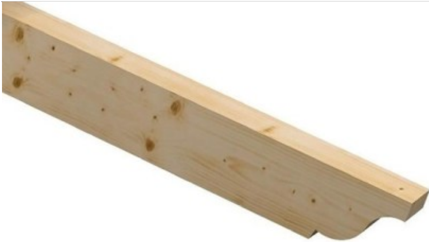
Palombella 1 Lato