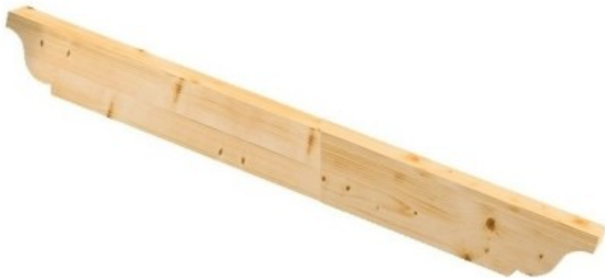
Palombella 2 Lati

Classe di resistenza GL24H. Possibilità di fornire la trave lamellare con sagoma a palombella su un lato o entrambi i lati, selezionando tale