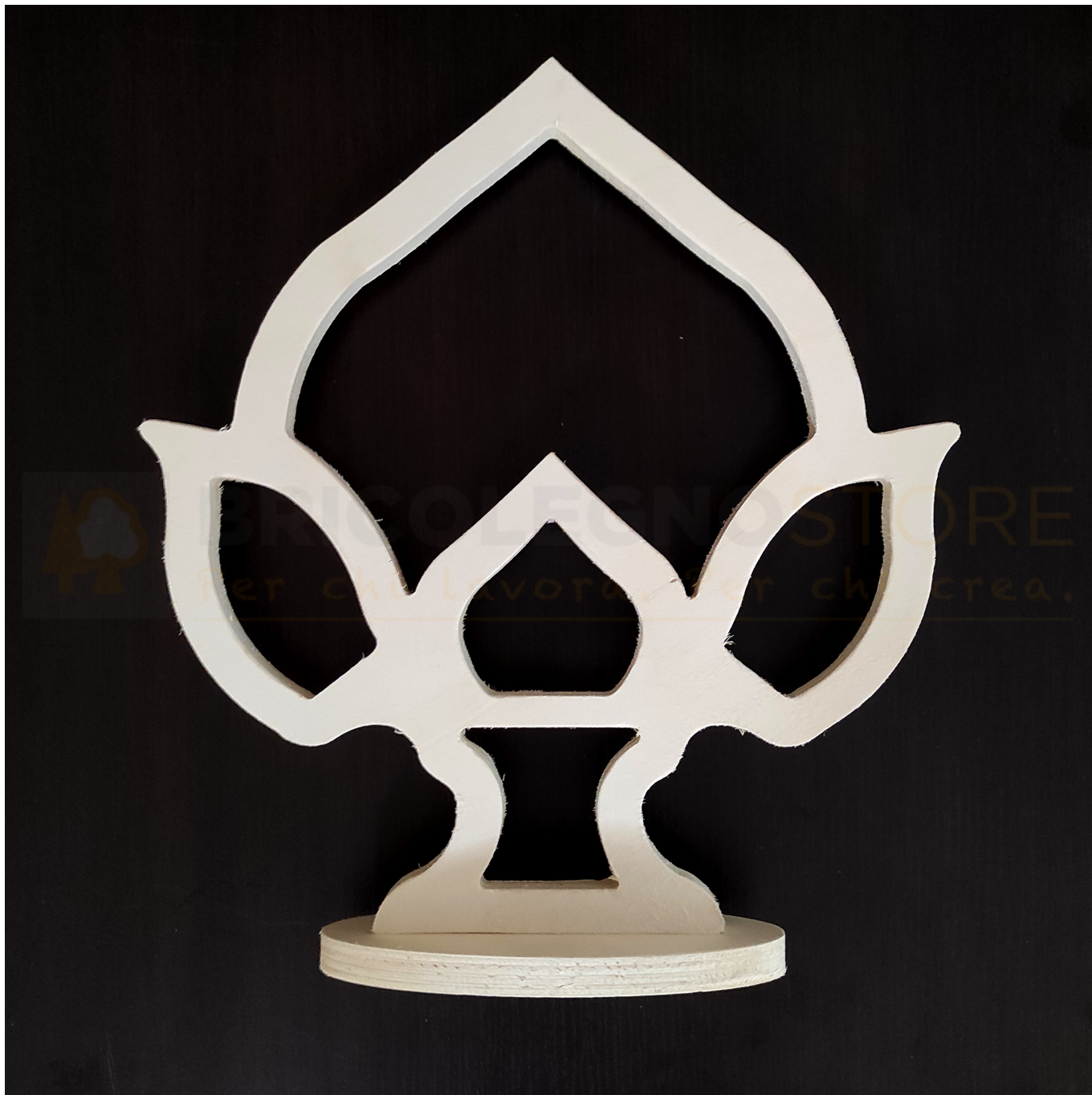
Telaio per Luminaria H 460 x L 410 mm Sag. 13 - Pumo Pugliese