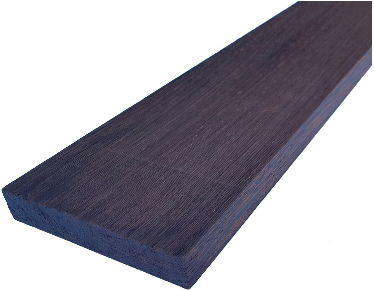
Tavola in legno Massello di Wengè grezzo - Bricolegnostore