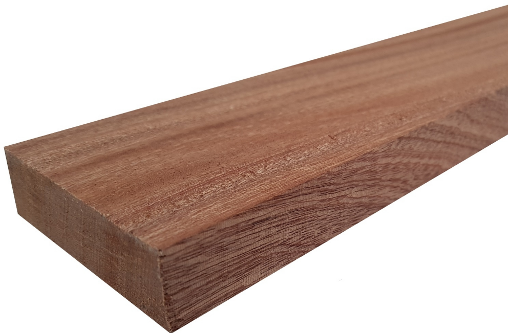
Tavola legno di Mogano Sapelli Refilato Piallato mm 32 x 290 x 2250