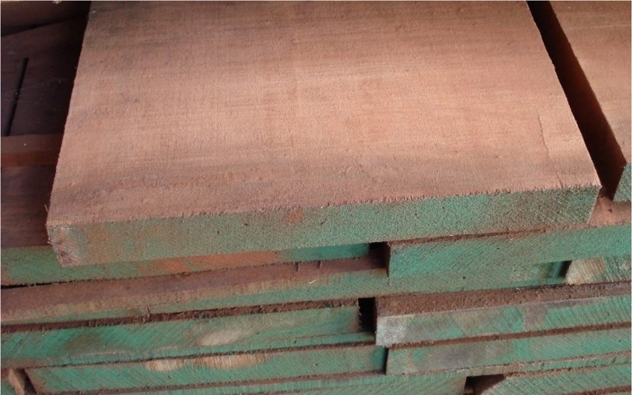
Tavola Legno di Mogano Sapelli Refilato Grezzo mm 40 x 200 x 2400