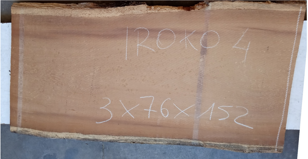
Tavola Legno di Iroko Non Refilato Grezzo mm 30 x 760 x 1520