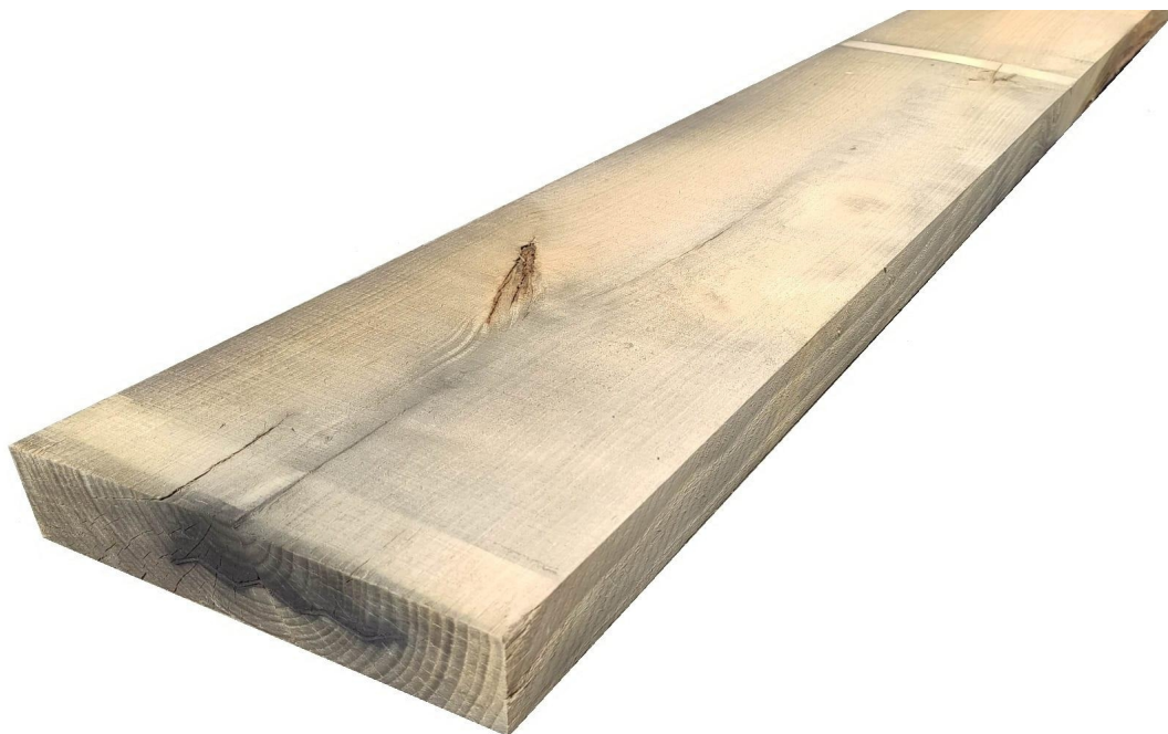
Tavola Legno di Castagno Nazionale Refilato Grezzo mm 52 x 160 x 1700