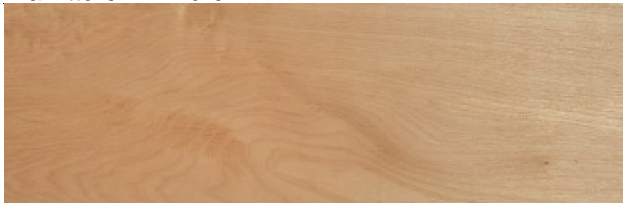
Tavola in legno massello di Acero Rosa Americano, conosciuto anche come Pacific Coast Maple, fornito refilato essiccato calibrato, pronto per la lavorazione.