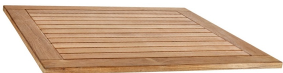
Piano Tavolo in legno di Iroko massello per imbarcazioni