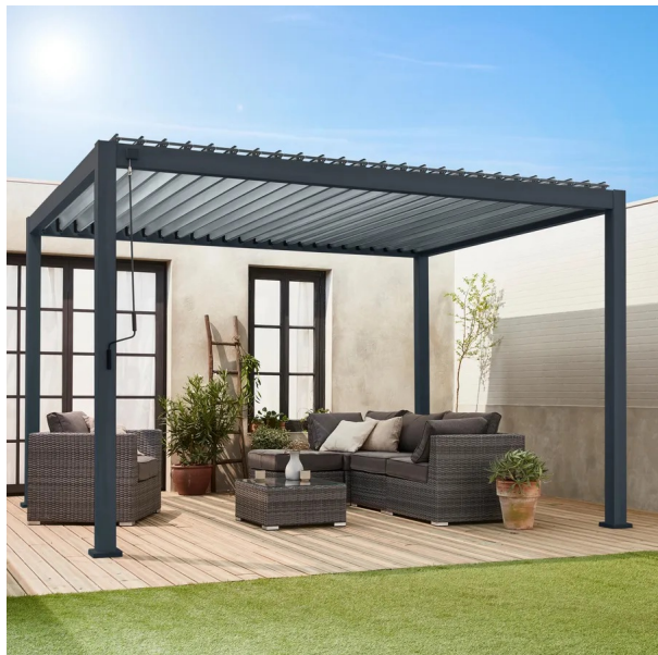
Pergola Autoportante in Alluminio Bioclimatica