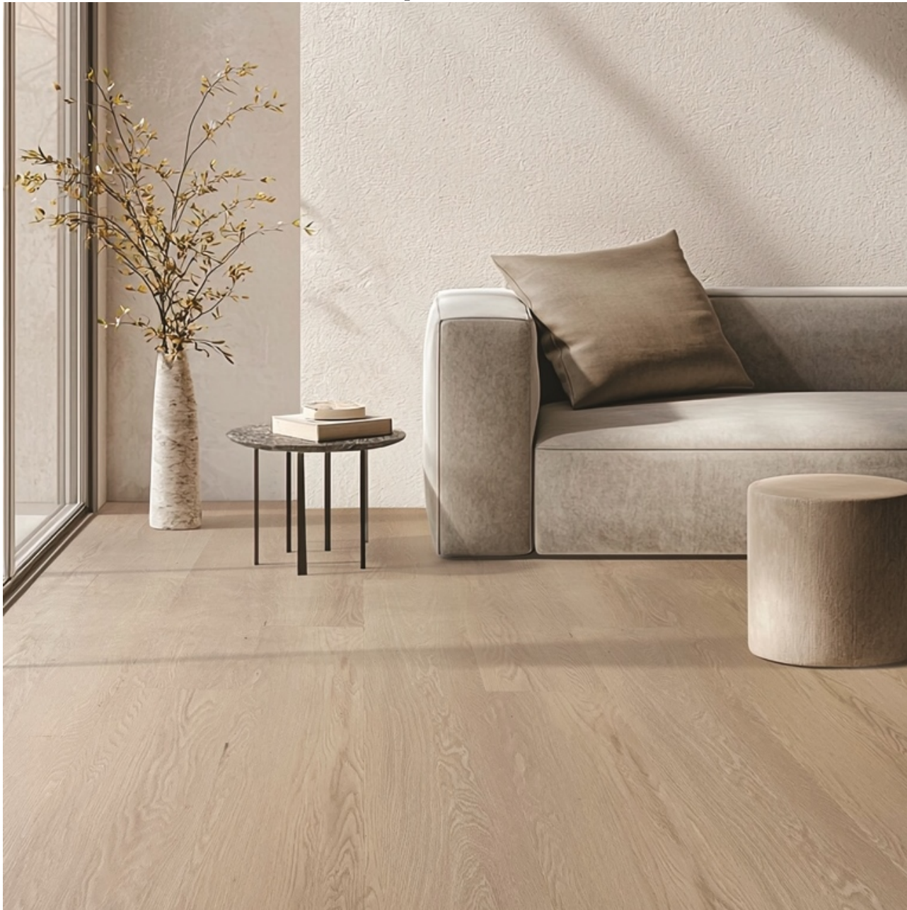
Pavimento Parquet in ESPC