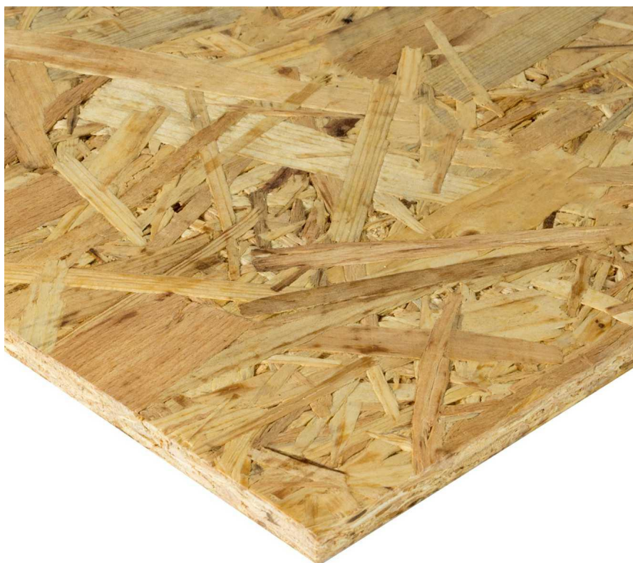
Pannelli, fogli, legno, osb3