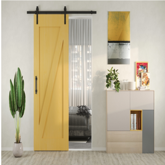
Maniglia Emuca per porte scorrevoli in legno Pasadena, lunghezza 240 mm, perno 180