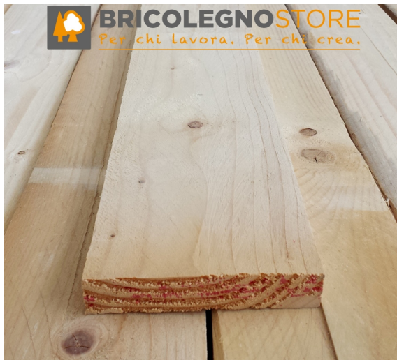
Tavola Legno di Abete Grezzo mm 25 x 100 x 3000