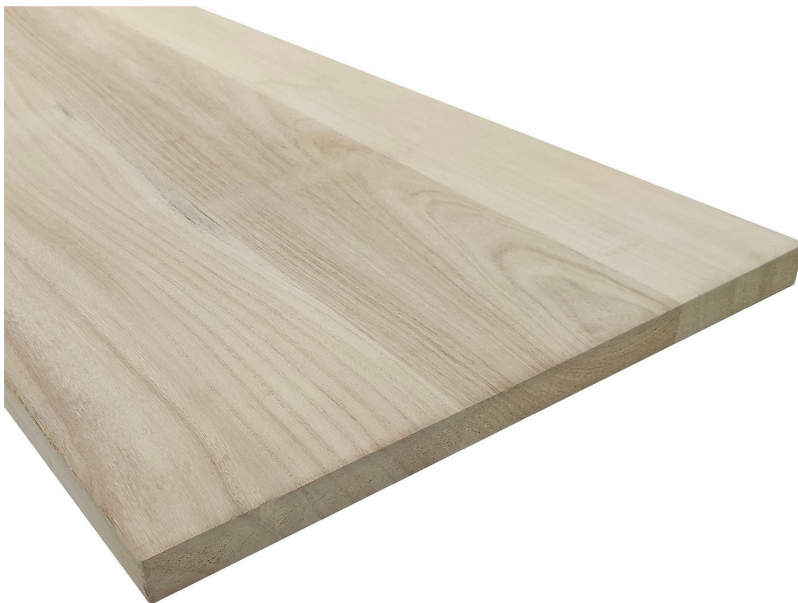
legno Lamellare di Paulownia