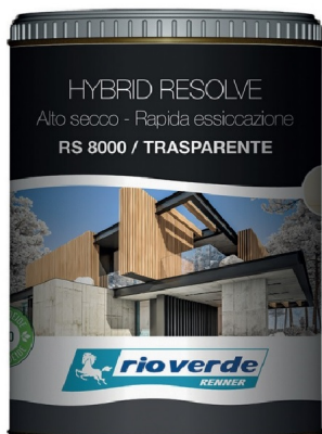
Impregnante Finitura Hybrid Resolve Rapida Essiccazione RS8000 Renner Rio Verde