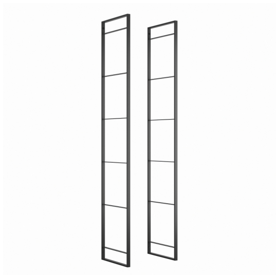
Emuca Struttura per Scaffale Lader, 1790, Verniciato nero, Acciaio