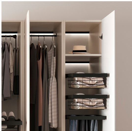
Emuca Set di distanziali laterali per telaio Hack, Plastica nera, Tecnoplasticato,