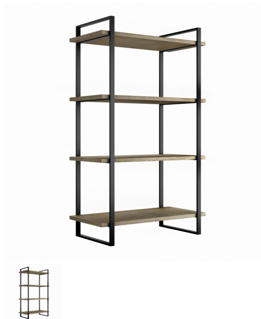
Emuca Scaffale Lader con struttura e ripiani, 1150, Verniciato nero, Acciaio e Legno