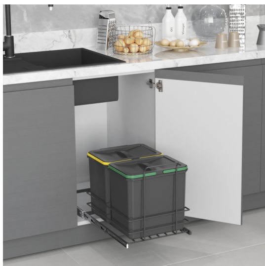
Emuca Pattumiera per differenziata Recycle da cucina, 2 x 16 L, fissaggio sul fondo ed

estrazione manuale, Tecnoplastica grigio antracite