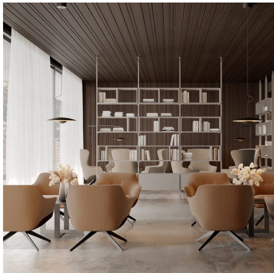
Emuca Kit Zero di supporti per mensole in legno e moduli, Color pietra, Zama e