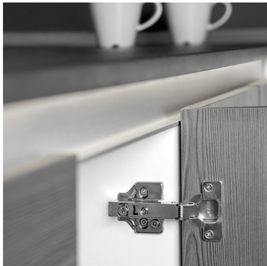
Emuca Kit cerniera collo dritto X92N e bassetta, Basetta a vite, Nichelato, Acciaio, 20 u.