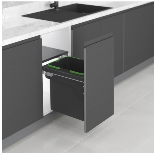
Emuca Contenitore per la raccolta differenziata Recycle 35L per cucina con fissaggio laterale, Acciaio e Tecnoplastica, Plastica grigio antracite