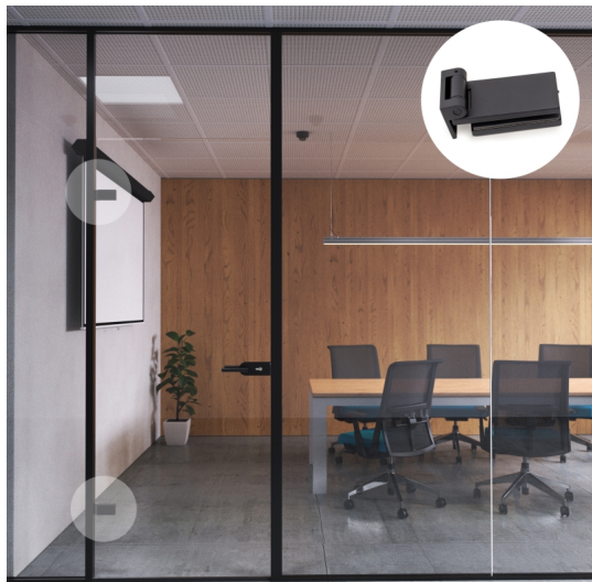
Emuca Cerniera per anta in vetro, cerniera orizzontale con forcella da 40 mm, per anta da 8-12 mm, alluminio e acciaio, verniciato nero