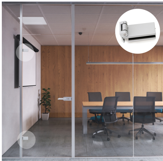
Emuca Cerniera per anta in vetro, cerniera orizzontale con forcella da 40 mm, per anta da 8-12 mm, alluminio e acciaio, grigio metallizzato