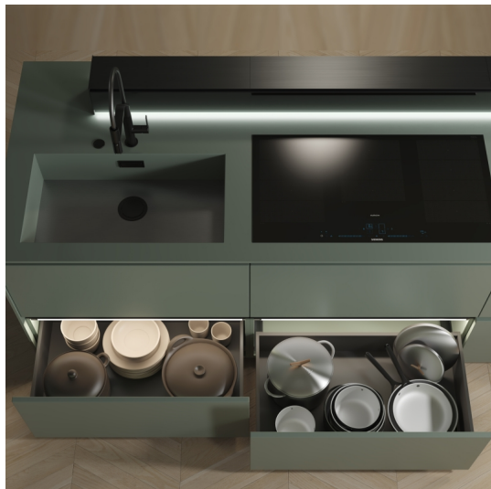
Emuca Cassetto esterno Vertex 3D 60 kg altezza 242 mm, profondità 450 mm,