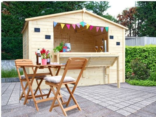
Chiosco miami cm. 310x300 - Chioschi in abete grezzo - Losa Esterni da vivere