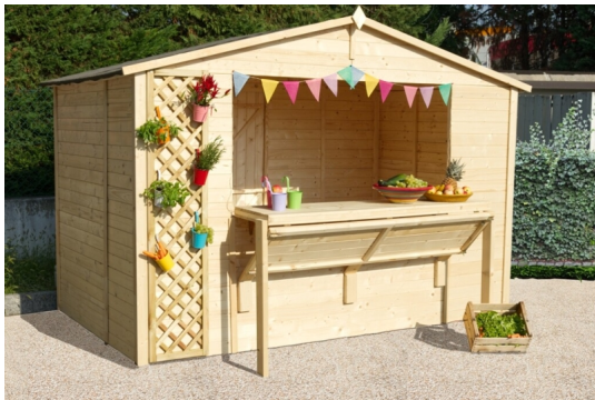
Chiosco rio cm. 310x180 - Chioschi in abete grezzo - Losa Esterni da vivere