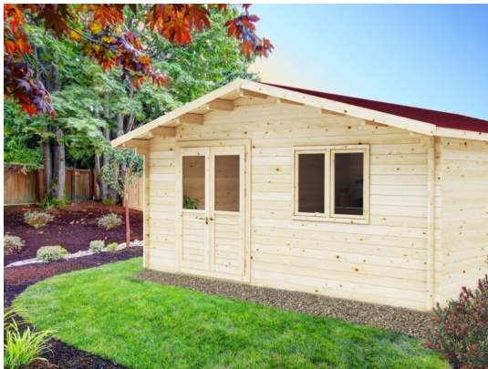
Casetta anna cm 600x600 - Casette in abete grezzo - ESTERNI DA VIVERE