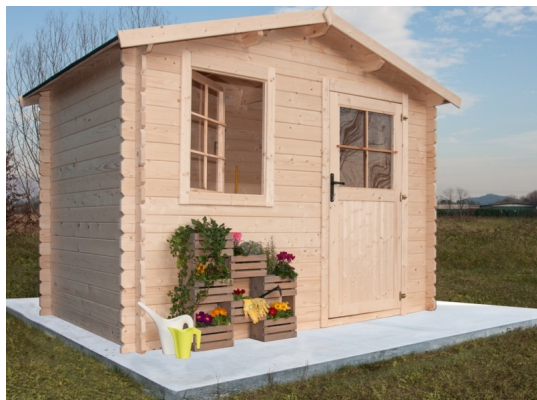
Casetta malaga 300x250 - Casette in abete grezzo - Losa Esterni da vivere