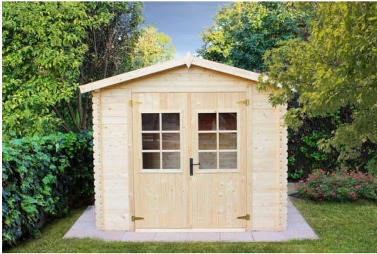
Casetta viola cm. 246x300 - Casette in abete grezzo - Losa Esterni da vivere