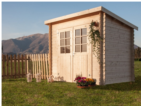
Casetta nina cm 250x200 - Casette in abete grezzo - Losa Esterni da vivere