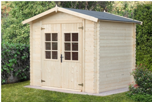
Casetta sara cm. 246x200 - Casette in abete grezzo - Losa Esterni da vivere