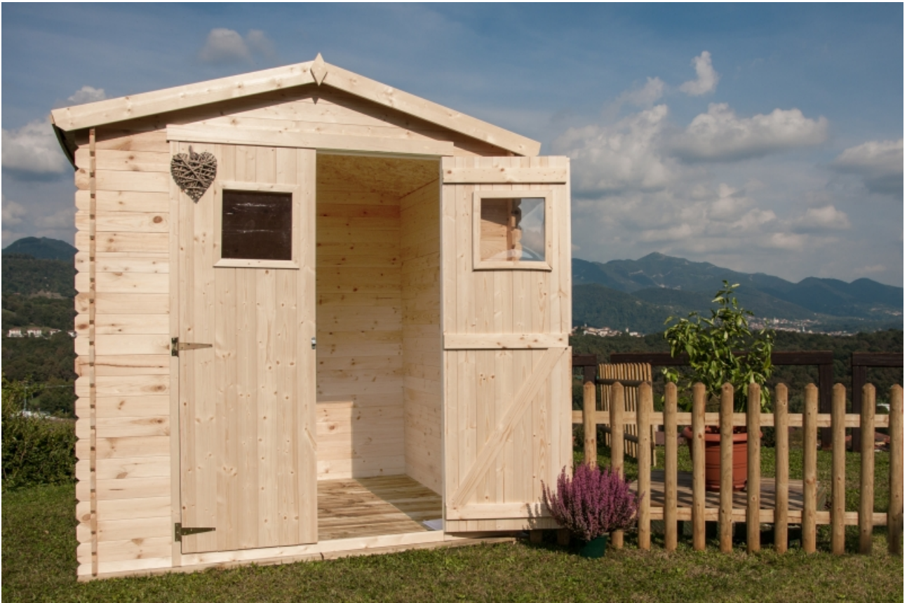
Casetta giulia cm. 200x200 - Casette in abete grezzo - Losa Esterni da vivere