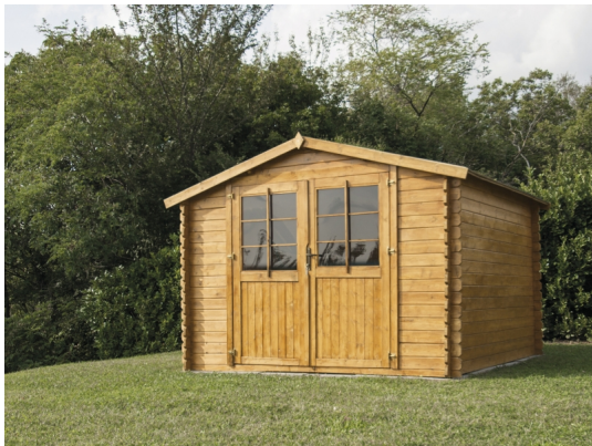
Casetta rita cm 300x300 - Casette impregnate in autoclave - ESTERNI DA VIVERE