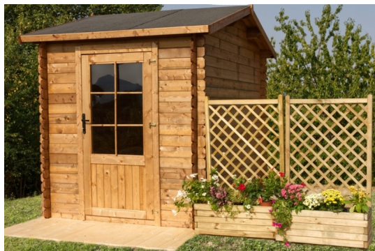
Casetta elena cm. 250x300 - Casette impregnate in autoclave - Losa Esterni da vivere