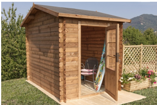
Casetta ilaria cm. 200x300 - Casette impregnate in autoclave - Losa Esterni da vivere