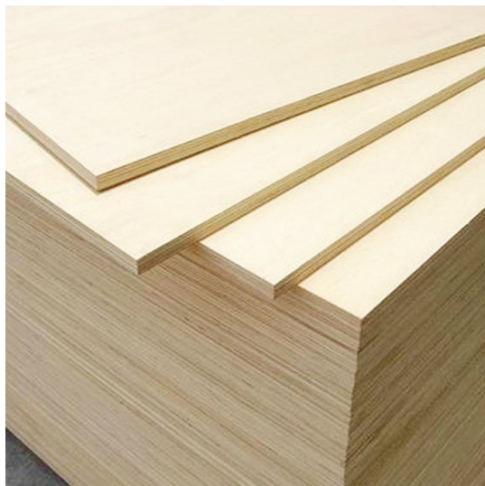
Compensato, multistrato, pioppo, monte, bricolegnostore