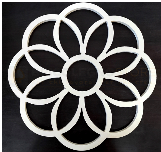
Telaio per Luminaria Sag. 42 Diametro mm 590 - Bricolegnostore