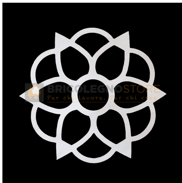
Telaio per Luminaria Sag. 124 Varie Dimensioni