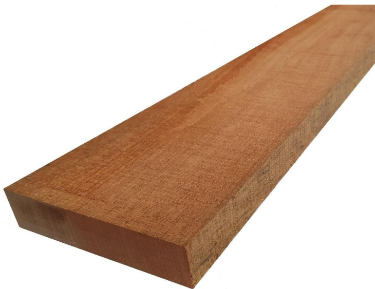
Tavola, listello, legno, massello, okoume, grezzo,