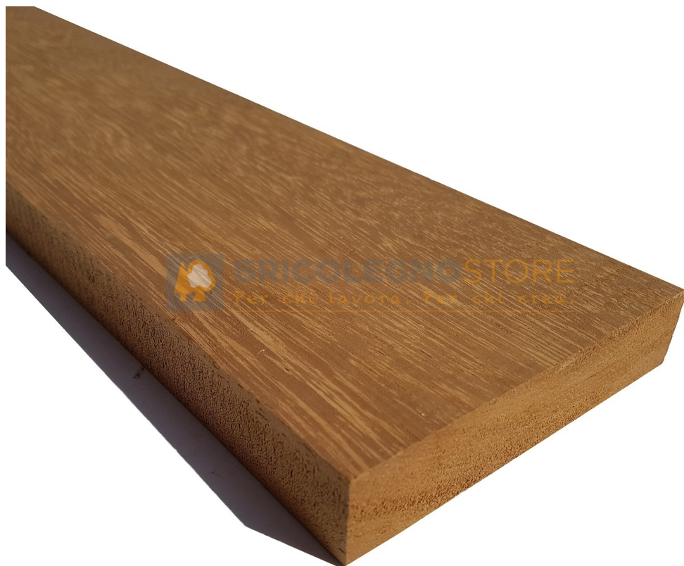
Tavola Legno di Iroko Refilato Grezzo mm 42 x 320 x 4000