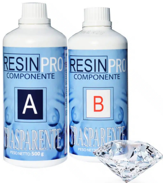
Resina Epossidica Trasparente Atossica Multiuso Resin Pro