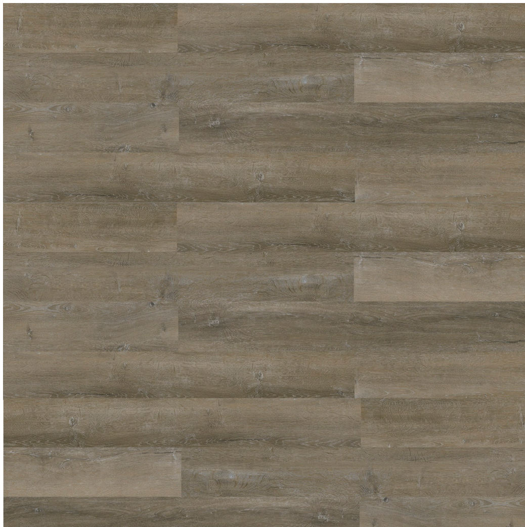
Parquet Laminato in SPC Finitura