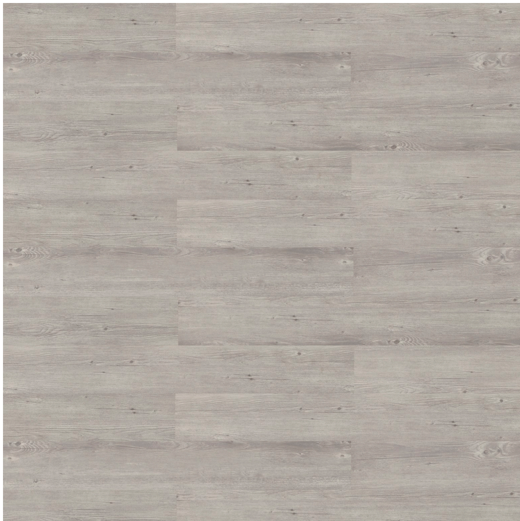
Parquet Laminato in SPC Finitura