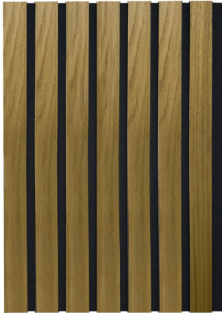
Pannello Decorativo 3D in MDF Laminato Effetto Legno