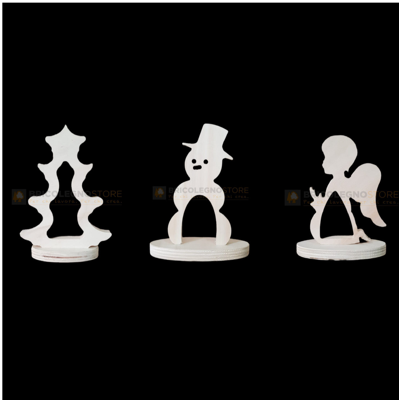
Mini telai per luminarie salentine Natalizie