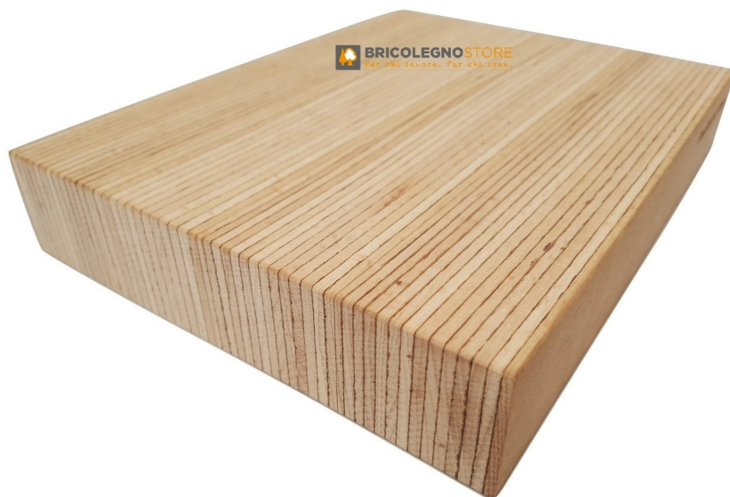
Faggio BauBuche Tavolato