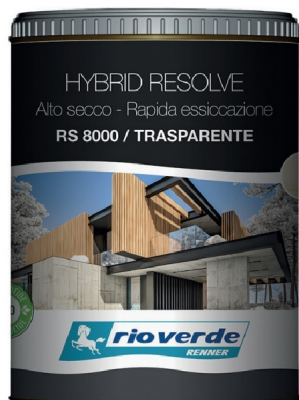
Impregnante Finitura Hybrid Resolve Rapida Essiccazione RS8000 Renner Rio Verde