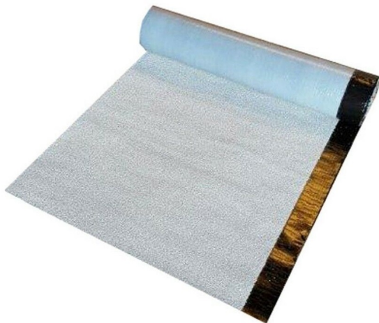
Guaina Bituminosa Ardesiata Bianca